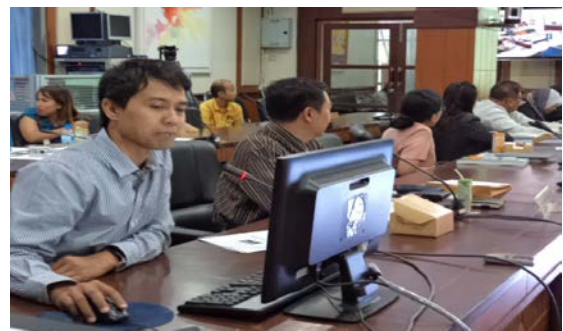
การรายงานผลการดำเนินงานหน่วยวิจัย ศูนย์วิจัยฯ วันที่ 5 สิงหาคม 2557