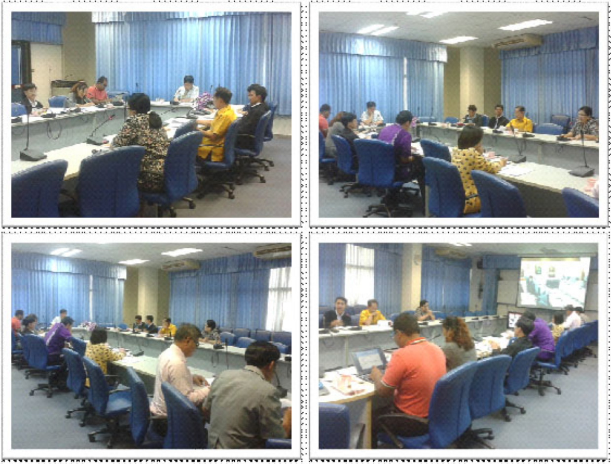
บรรยากาศการประชุม ณ ห้องประชุม SC๒๑๖ คณะวิทยาศาสตร์ วิทยาเขตสงขลา