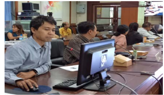
การรายงานผลการดำเนินงานหน่วยงานวิจัย ศูนย์วิจัยฯ วันที่ 5 สิงหาคม 2557