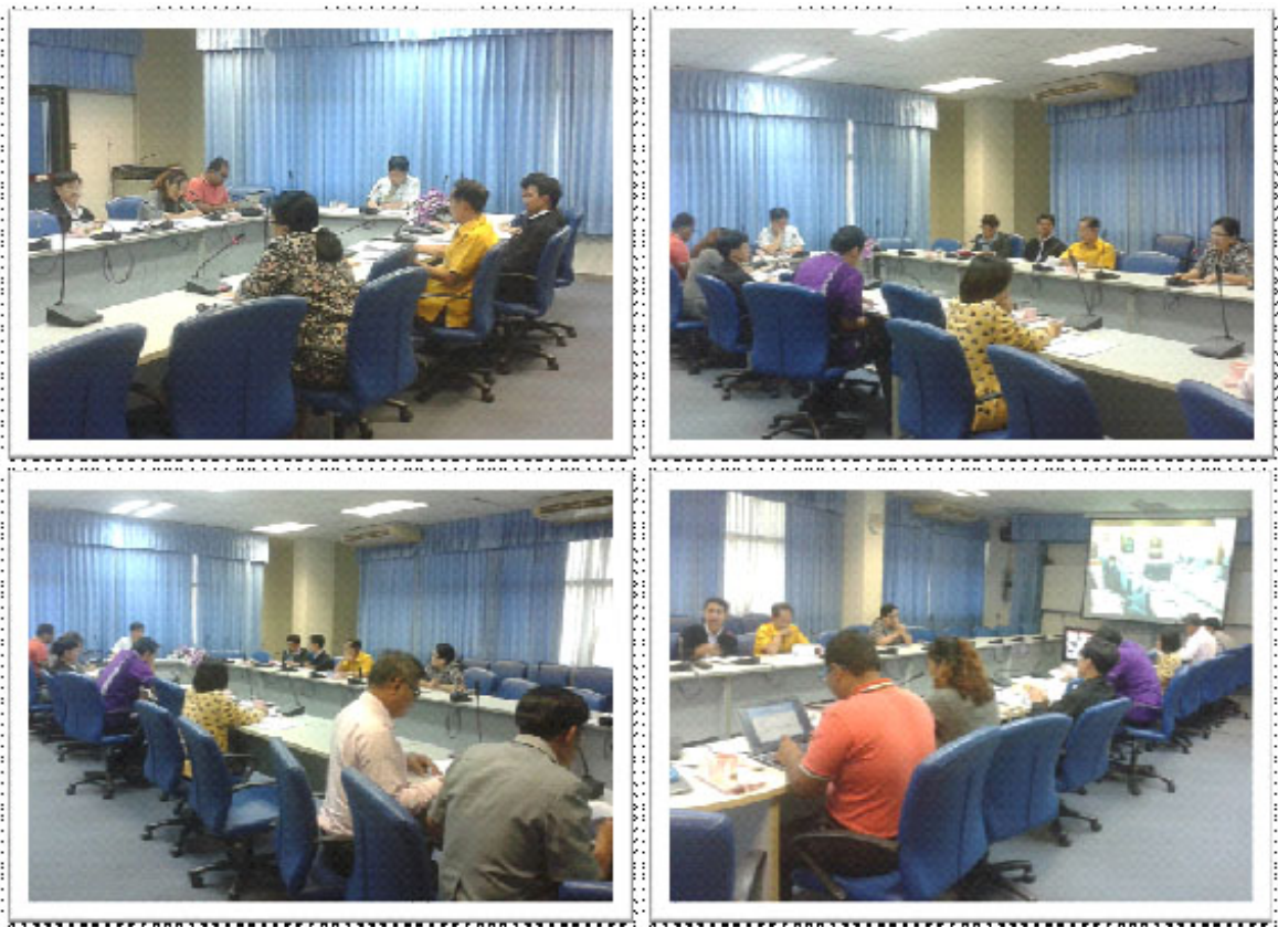
กิจกรรมสะท้อนปัญหาการดำเนินงาน ความต้องการของหน่วยวิจัยฯ วันที่ 5 มีนาคม 2558 ณ ห้องประชุม SC216 คณะวิทยาศาสตร์ วิทยาเขตสงขลา