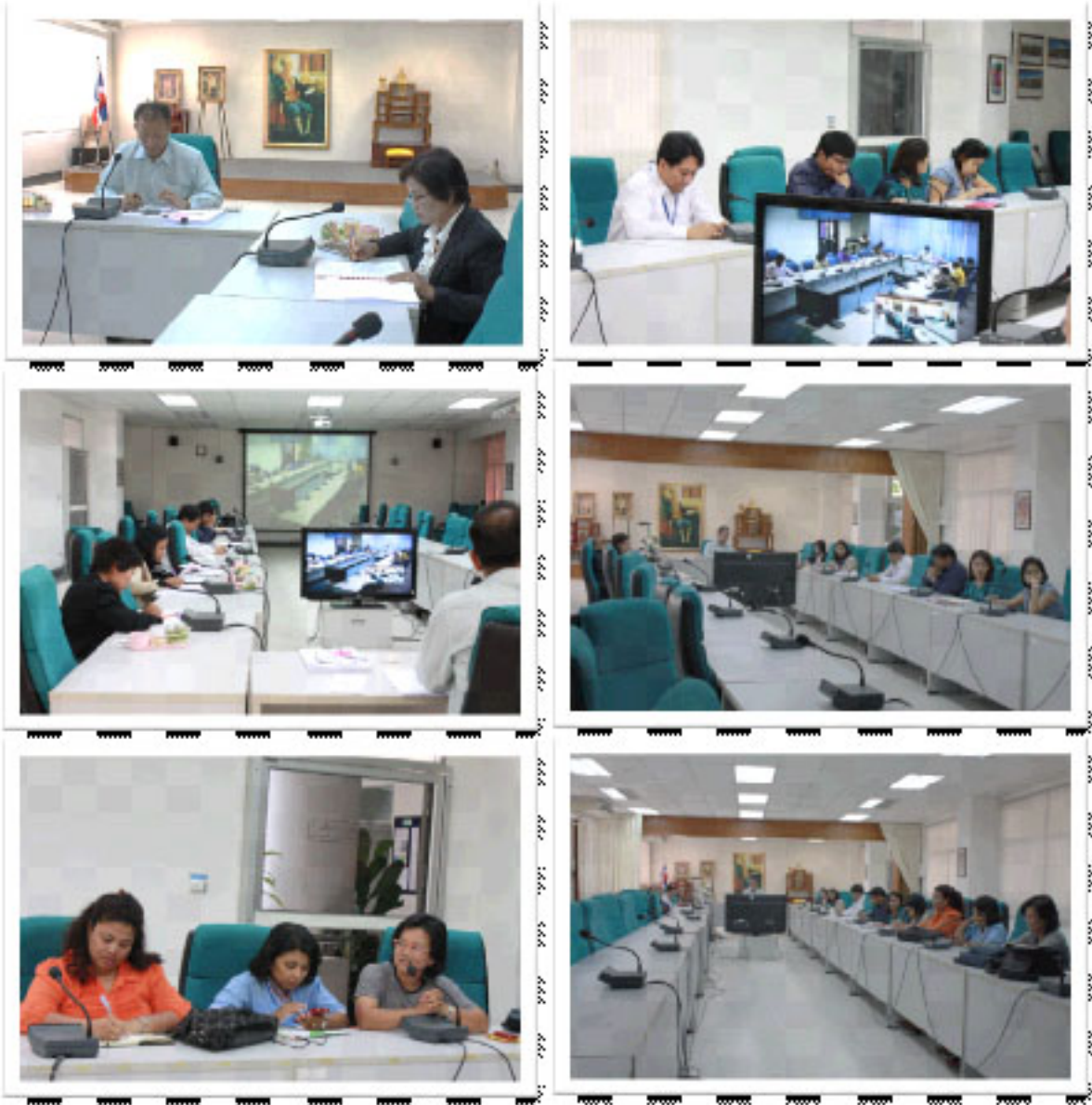
กิจกรรมสะท้อนปัญหาการดำเนินงาน ความต้องการของหน่วยวิจัยฯ วันที่ 5 มีนาคม 2558 ณ ห้องประชุมทางไกลทานตะวัน SC1218 คณะวิทยาศาสตร์ วิทยาเขตพัทลุง