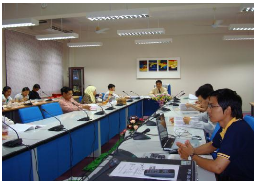
คณะมนุษยศาสตร์และสังคมศาสตร์ และคณะศิลปกรรมศาสตร์ เมื่อวันที่ 22 กรกฎาคม 2552 ณ ห้องประชุม 13220 คณะมนุษยศาสตร์และสังคมศาสตร์ วิทยาเขตสงขลา